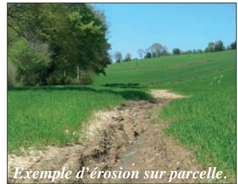
Exemple d'érosion sur parcelle.

«J'ai modifié ma manière de semer : je ne le fais plus perpendiculairement à la pente».