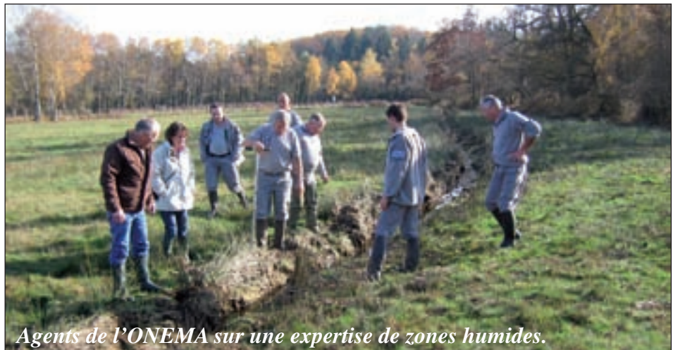
Agents de l'ONEMA sur une expertise de zones humides.