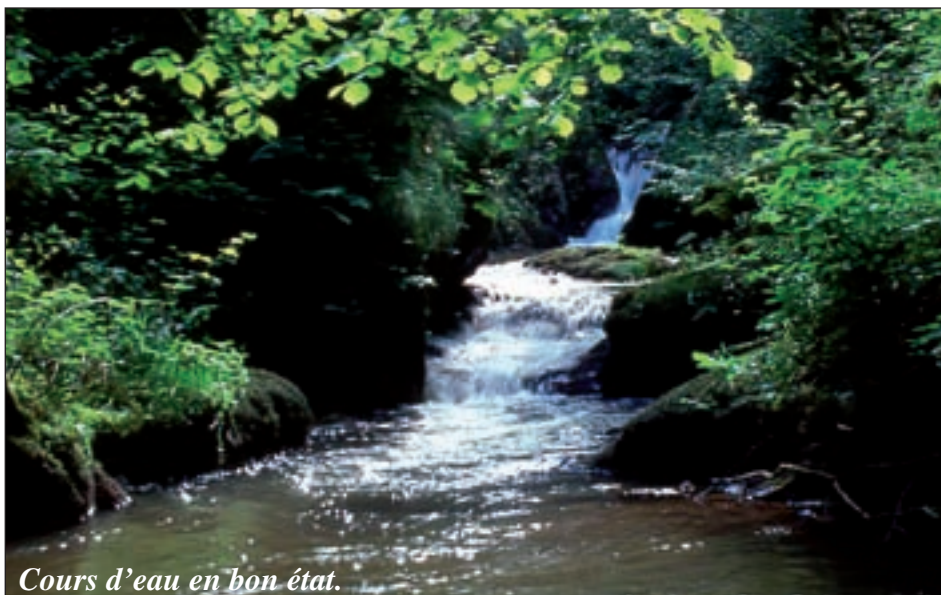
Cours d'eau en bon état.

Des parcours destinés à divers publics (familles, jeunes...) devraient suivre. En projet également : recruter un technicien piscicole qui interviendrait sur les quatre bassins versants aveyronnais (Lot, Aveyron, Viaur, Tarn) et mener une étude sur le bassin versant du Viaur, « très précise, ruisseau par ruisseau, avec tous les partenaires. Cela permettra de déterminer les enjeux pour les pêcheurs mais aussi pour tous les autres intervenants ».