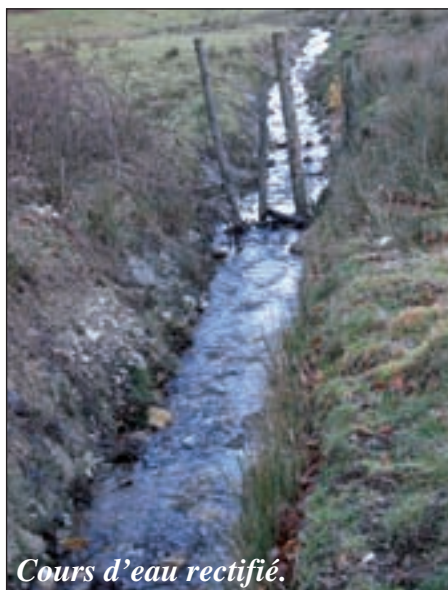
Cours d'eau rectifié.

Le travail que le Contrat de Rivière souhaite mener sur le bassin versant du Viaur doit permettre d'aboutir à un territoire dynamique économiquement et un environnement de qualité. Ces deux visions (économique et environnementale) doivent être prises en compte de manière équilibrée. Pour atteindre cet objectif, il est, dans un premier temps, indispensable de réaliser un état des lieux complet. Cela suppose plusieurs diagnostics : technico-économique du territoire d'une part, environnemental des cours d'eau et du bassin versant d'autre part. Ce dernier est réalisé à travers un diagnostic du fonctionnement du bassin versant, un diagnostic physicochimique de la qualité des eaux, un diagnostic biologique des cours d'eau (la vie dans le cours d'eau), celui-ci étant notamment fondé sur l'analyse piscicole.