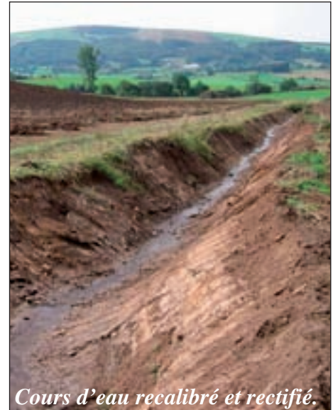
Cours d'eau recalibré et rectifié.

Le bilan n'est donc pas enthousiasmant. Mais pour les deux hydrobiologistes, les contraintes liées aux objectifs de la Directive européenne pourraient être incitatives. « S'ils ne sont pas atteints en 2015 ou 2021, ce sont tous les citoyens qui en paieront les conséquences ». Pour l'heure, sur le terrain, les observa-