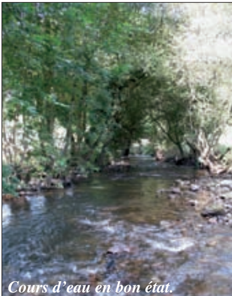
Cours d'eau en bon état.

Connaître et faire connaître les milieux aquatiques et leurs peuplements, gérer, restaurer et valoriser celui-ci : ainsi peut-on résumer les missions de la fédération pour la pêche et la protection du milieu aquatique. Concrètement, cela se traduit par l'élaboration d'un schéma départemental de vocation piscicole. Fruit de dix ans de travail, il a été approuvé par arrêté préfectoral le 15 octobre 2008. Y figure bien sûr l'état de santé du bassin versant du Viaur qui fut utilisé comme outil de travail pour le premier Contrat de rivière du Viaur. Prolongement de ce premier bilan, le Plan départemental pour la protection des