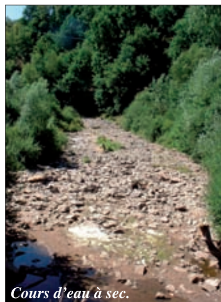
Cours d'eau à sec.

Sur le bassin versant du Viaur, le syndicat mixte et les différents par-