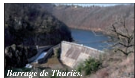
Barrage de Thuriers.

Autre facteur parmi d'autres qu'ils énu-