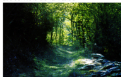
Les sentiers de la vallée