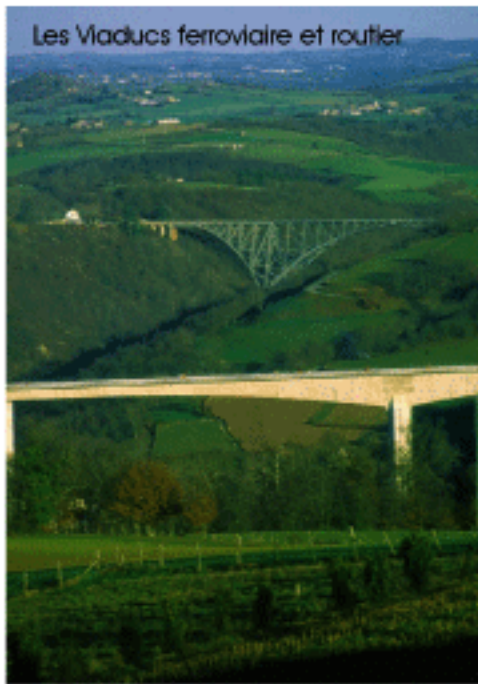
Les Viaducs ferroviaire et routier