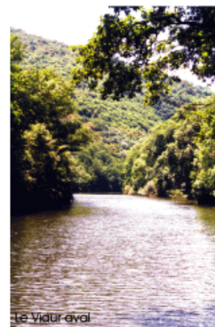
Le Viaur aval