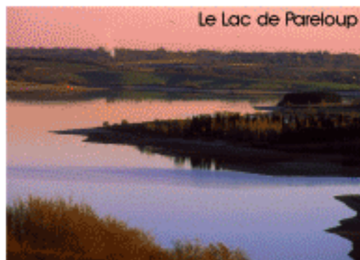
Le Lac de Pareloup